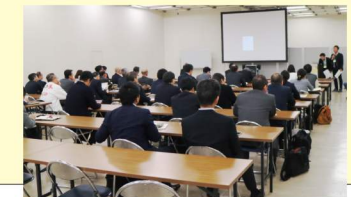
セミナーイメージ

1日目・2日目 ●セミナー 10:30～12:30 [各会場とも] ●展示商談会 1日目 13:00～17:00 受付 10:00 2日目 10:00～16:00