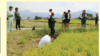
現地交流会イメージ

現地の圃場、ライスセンター等を見学し、現地の生産者や農協関係者等との意見交換を行い取引の商談を深めていきます。