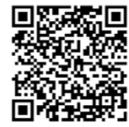
オンライン商談会 申し込みフォーム

https://survey.kome-matching.com/zs/k6zVSd